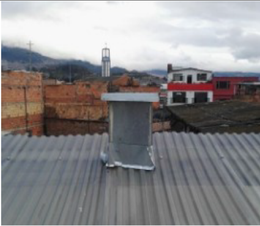
FOTOGRAFÍA 3 DUCTO DE DESFOGUE DE LA ESTUFA