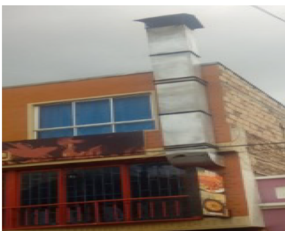
FOTOGRAFÍA 5 DUCTO DE DESFOGUE DEL ASADOR