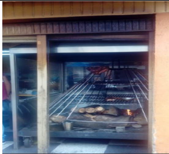
FOTOGRAFÍA 4 ASADOR TIPO TROMPO