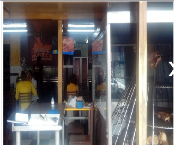
FOTOGRAFÍA 6. INTERIOR DEL ESTABLECIMIENTO